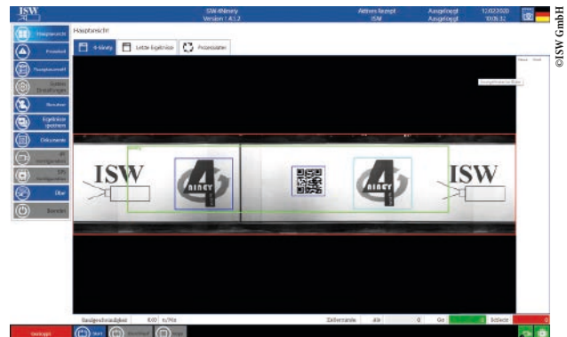
Zusammengesetzte abgewinkelte 360°-Aufnahme zur Code-Kontrolle eines rotations-symmetrischen Produktes.

können. Bei der Etikettenerkennung setzt ISW auf einen Graustufen- und Kontur-Algorithmus, der aufgenommene Etiketten mit einem Master vergleicht. Bei Unterschieden wird das Produkt ausgeworfen.